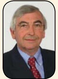
Christian Verougstraete Vlaams volksvertegenwoordiger

Het Vlaams Belang is van oordeel dat de uitbouw van een Vlaams huursubsidiesysteem de enige manier is om iedereen een volwaardige en betaalbare woonst te waarborgen. Volgens het Vlaams Belang is een huursubsidie een goede remedie tegen koopkrachtverlies van de lage inkomens. Het bedrag van de ontvangen huursubsidie moet daarbij afhankelijk worden gemaakt van het inkomen en de gezinssituatie van de huurder. De woningen waarvoor de huursubsidie wordt aangevraagd moeten vanzelfsprekend voldoen aan de minimumkwaliteitsnormen van de Vlaamse Wooncode.